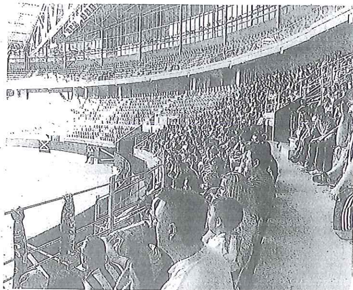
Público en un espectáculo ajeno a la noticia, en el Iradier.